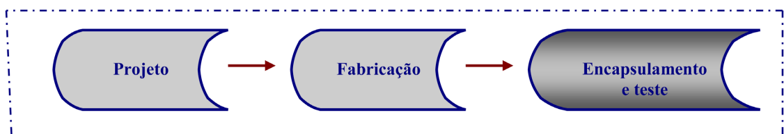
Figura 2. Etapas do processo de produção de semicondutores.

Para a UNISINOS, o investimento no projeto sistêmico de semicondutores (construção da planta produtiva, do instituto tecnológico de semicondutores - itt CHIP e de novos cursos de formação acadêmica) torna-se de elevado interesse estratégico, especialmente pelas externalidades positivas que tal projeto gerará a toda a universidade, especialmente nas áreas de engenharias. O itt CHIP, cujo projeto está em fase de implementação, atuará não só como um centro de pesquisas em encapsulamento de semicondutores, mas também como um locus de capacitação de recursos humanos na área. Nessa perspectiva, o projeto UNISINOS – HT Micron tem, em um primeiro momento, uma meta tangível para ambos os atores, que é a construção de uma planta industrial apta a encapsular e testar